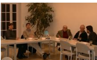
ANCES-Generaversammlung 2001 am Kannerheim Itzig