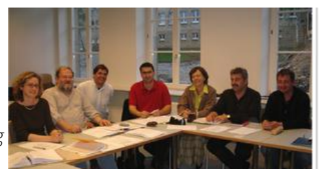
ANCES-Generaversammlung 2005 um Campus Walfer