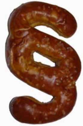
Bilder: Wilfried Nodes

Zur Begründung führt das Oberlandesgericht aus, die Beklagte habe den Kläger rechtswidrig und schuldhaft in seinem allgemeinen Persönlichkeitsrecht verletzt, indem sie einen unnötig großen Personenkreis über ihren Verdacht unterrichtet habe. Sie hätte sich darauf beschränken müssen, ihren Verdacht gegenüber den für die Aufklärung zuständigen Behörden – städtische Stellen für Kinderschutz, Polizei und Staatsanwaltschaft – zu äußern. Die Unterrichtung des Arbeitgebers des Klägers sowie anderer Personen hätte sie damals jedoch unterlassen müssen. Soweit sich die Beklagte darauf berufe, sie habe dies zum Schutz des Kindes für erforderlich gehalten, hätte es genügt, die zuständigen Behörden auf diese Einschätzung hinzuweisen.