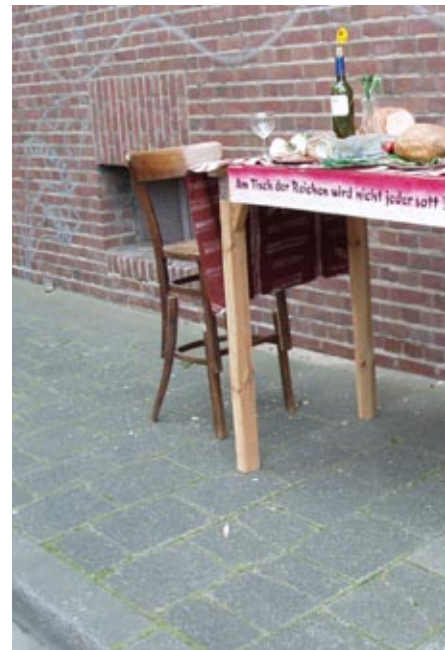
„Am Tisch der Reichen wird nicht jeder satt“, Bild: pixelio.de (Gerhardt)

In einem uns vorliegenden „pro cura“-Arbeitsvertrag orientiert sich die Eingruppierung an den