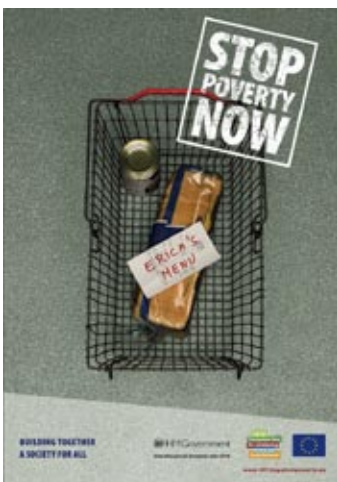
Bildserie der EU zum Jahr gegen Armut und soziale Exklusion - www.2010againstopoverty.eu

Die Altersstruktur der Wohnungslosen hat sich deutlich verändert. Der Anteil junger Erwachsener – insbesondere bis 24 Jahre – nimmt überproportional zu. Zunehmend mehr Minderjährige leben in Obdachloseneinrichtungen für Erwachsene. Als ein Grund für die „Verjüngung“ von Obdachlosigkeit sind die Schnittstellenprobleme zwischen dem Zweiten Buch Sozialgesetzbuch (SGB II) und dem SGB VIII zu sehen. So überschneiden sich beispielsweise Hilfen der Jugendsozialarbeit (§ 13 SGB VIII) mit den möglichen Hilfen durch SGB-II- und SGB-III-Träger. Die Bundesregierung kann allerdings zwischen dem SGB II und SGB VIII keine Systembrüche er-